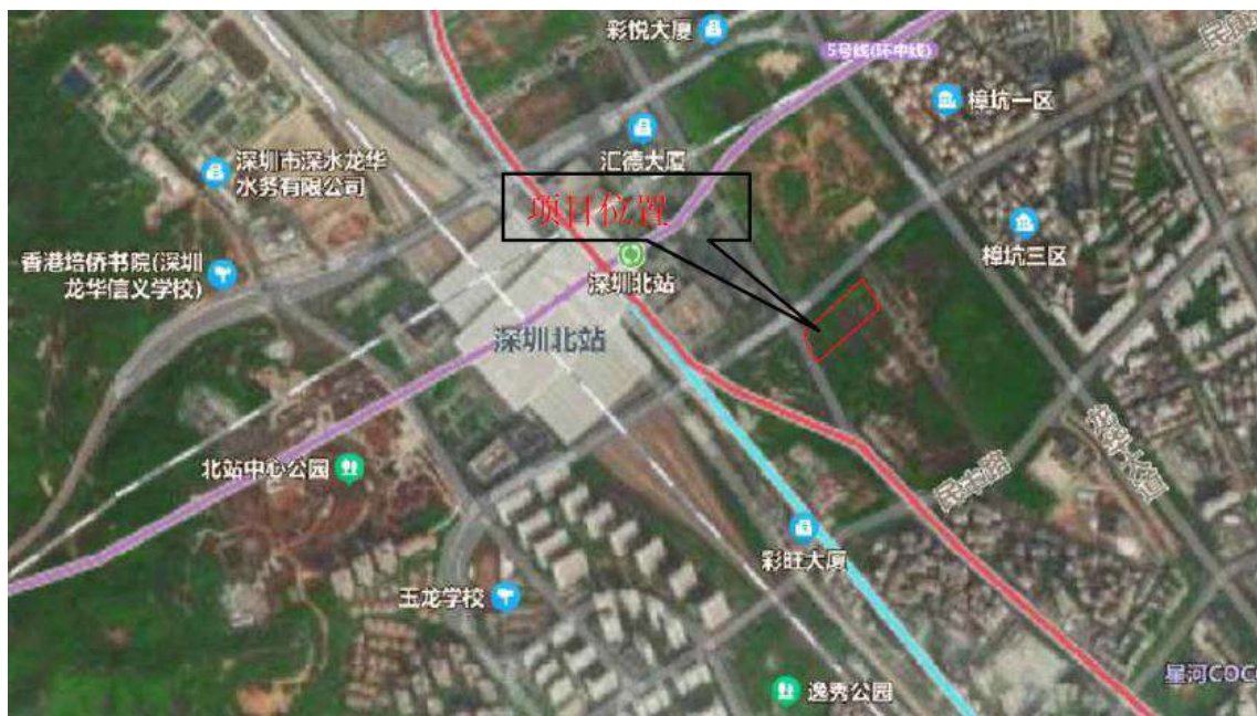
图 1 项目地理位置图

北站国际商务区 06-06 和 06-09 地块场平工程位于深圳市龙华区民治街道北站新城地区，地块西临现状深远南路、东临现状龙华大道，北临现状玉龙路，南临规划满园街。