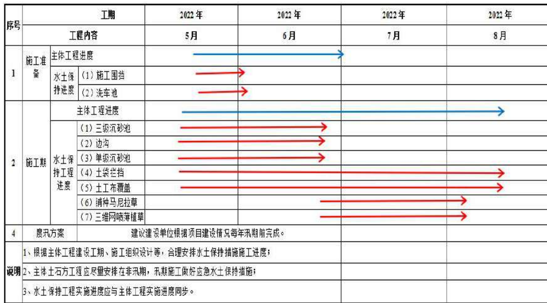
表 4-1 基础工程施工进度表

本工程基础工程于 2022 年 5 月开工,于 2022 年 8 月建成,总建设工期 4 个月。施工单位进场后,即安排施工单位开展水土保持措施施工,施工进度见下表: