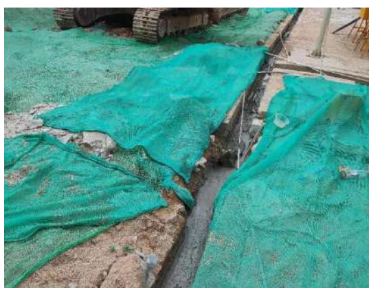
覆盖措施（现已废除）